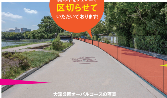
大濠公園オーバルコースの写真