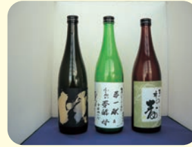
福岡オリジナル吟醸酒

福岡県では、生物の持つ能力や性質をいかす「バイオ技術」を活用して、産業を振興しています。久留米市など筑後地域は、昔から醤油や味噌など発酵食品の製造が盛んであり、また日本酒を造る酒蔵もたくさんあります。この地域を中心に新しい薬や健康食品、福岡県独自のお酒などの製品ができたり、バイオに関係する企業が新しく設立されたりするよう、研究開発の支援などを行っています。