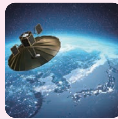
福岡県の宇宙ベンチャー （株）QPS研究所が開発した 超小型レーダー衛星

福岡県には、宇宙開発に挑戦する企業や、宇宙に関する研究を行っている九州大学、九州工業大学などがあります。このような企業、大学といっしょに、人工衛星やロケット、人工衛星からのデータを活用した新しいサービスの開発に取り組んでおり、宇宙ビジネス振興の取り組みに熱心な県として、国から「宇宙ビジネス創出推進自治体」に選ばれています。