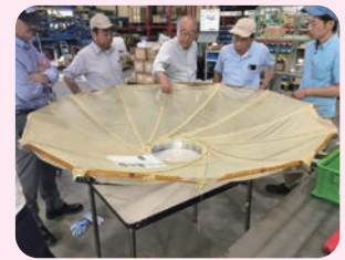
衛星の開発には県内のたくさんの ものづくり企業が関わっています （提供：（株）QPS研究所）