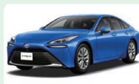
自動車は走る半導体と呼ばれ、1台に約数十個から100個程の半導体が使われています