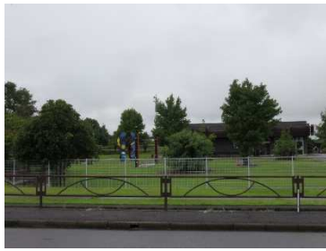
（会場（再生工房）の様子）