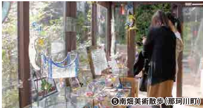
⑤南畑美術散歩(那珂川町)