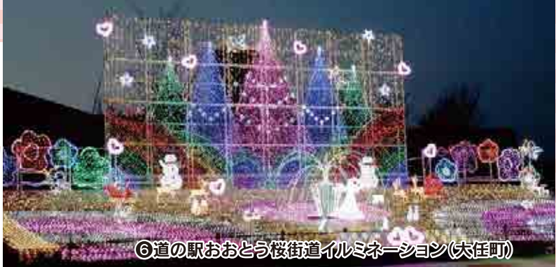
⑥道の駅おおとう桜街道イルミネーション(大任町)