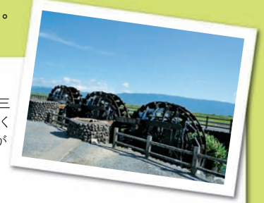
国指定史跡である「三連水車」をはじめ、多くの農業遺産や文化が残る筑後川中流域

県では、NPO・ボランティアや企業、行政など、多様な主体の「協働」による「新しい共助社会」づくりを進めています。このコーナーでは、毎号、新しい共助社会づくりに取り組む皆さんをご紹介します。