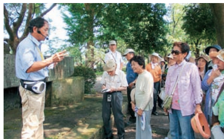
8月と12月の2度の見学ツアーには、80人以上が参加。参加者は筑後川中流域の農業の歴史を体感しながら巡った

九州一の大河、筑後川。「山田堰」は、その激しい水の流れを斜めにせき止め、3方向に水流の力を分散させて、堀川用水に導く仕組み