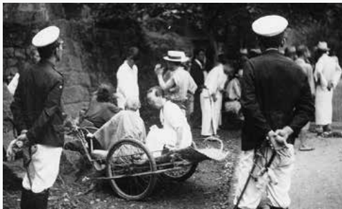
ハンセン病と診断された患者は強制的に療養所に入所させられました。

1953年(昭和28年)、患者の反対を押し切ってこの法律を引き継ぐ「らい予防法」が成立しました。この法律の問題点は、患者隔離が継続され、退所規定が設けられていないことでした。つまり、ハンセン病患者は療養所に収容されると