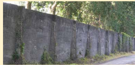
菊池恵楓園(熊本県)の隔離の壁

また、2019年(令和元年)、ハンセン病政策により家族も差別や偏見の被害を受けたとして、元患者の家族が国を相手に起こしたハンセン病家族訴訟についても、熊本地裁で原告勝訴の判決が下されました。