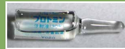
プロミン(注射薬)