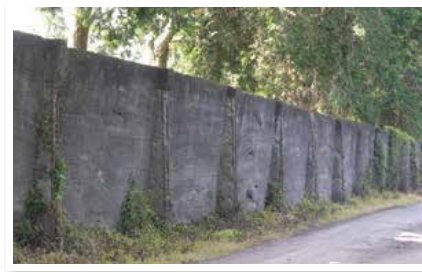
菊池恵楓園(熊本県)の隔離の壁

A 2001年(平成13年)、ハンセン病国家賠償訴訟の判決が熊本地裁であり、原告(ハンセン病療養所入所者)の訴えが認められました。国はハンセン病療養所入所者・退所者のみなさんに謝罪をし、2002年(平成14年)には、療養所を退所する人の社会復帰への援助として「退所者給与金事業」を開始しました。2008年(平成20年)には「ハンセン病問題の解決の促進に関する法律」が制定され、療養所の土地、建物等を地域に開放できるようになり、2012年(平成24年)には、菊池恵楓園と多摩全生園に保育所が開設されました。また、啓発(広く知ってもら)活動を積極的に行うなど、名誉回復のための対策を進めています。