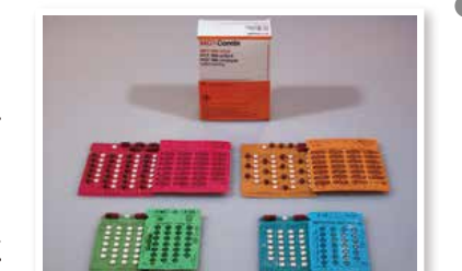
現在のハンセン病の薬

A よく効く薬があって完全に治ります。また、薬を飲むと数日で「らい菌」は感染力を失い、早期に治療すれば後遺症も残りません。今、療養所で生活している人のほとんどはもう治っています。