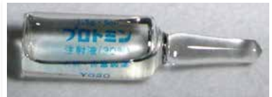
プロミン（注射薬）

A ハンセン病問題とは、近代以降の国のあやまったハンセン病対策が原因で、ハンセン病患者・元患者や家族が差別を受けた人権問題です。 ● 全国で、ハンセン病患者を見つけ出し療養所へ入所させたりする「無らい県運動」が行われました。また、「らい予防法」という法律で患者が強制的に療養所の中に閉じ込められたり、家が消毒されたりして、感染力が強い病気、怖い病気といったあやまった考えが広まりました。 ● 有効な治療薬「プロミン」ができるまでは、治らない病気とされていました。