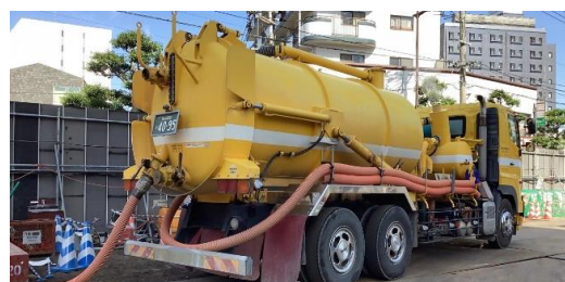
ポンプ車作業状況