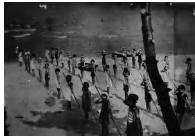
▲ 小学生のナギナタ訓練