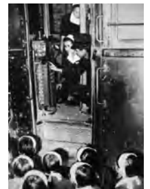
▲ 電車の運転方法を教わる女子挺身隊員