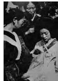
▲ 一針一針に必勝と生還を縫い込めた千人針の風景