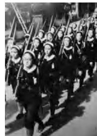
▲ 軍事訓練をする女学生