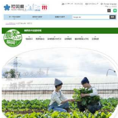
【「農業せんね！福岡で」ページ画面】