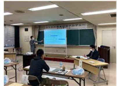
講座受講の様子（イメージ）