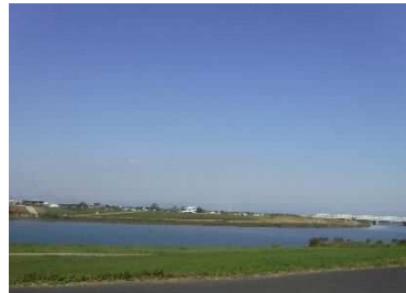
合川緑地からの眺望