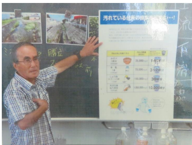
(上)「食品による水の汚れと、それにより汚れた川をきれいにするにはどれくらいの水が必要か」について、表を用いて説明する講師

視覚的・体感的に、生活排水が環境にどれだけ負荷をかけるのかを理解できることで、「一度汚したら大変だ」ということを意識づけられ、子ども達が「環境を守るために自分たちが何をすべきか」という問題意識を持つことにつながった。