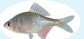
ニッポンバラタナゴ