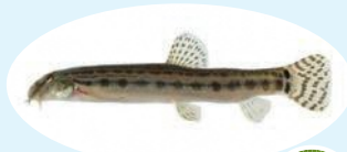
ヤマトシマドジョウ