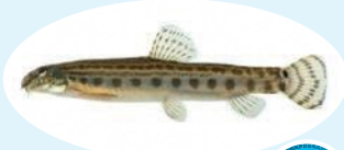
スジシマドジョウ類