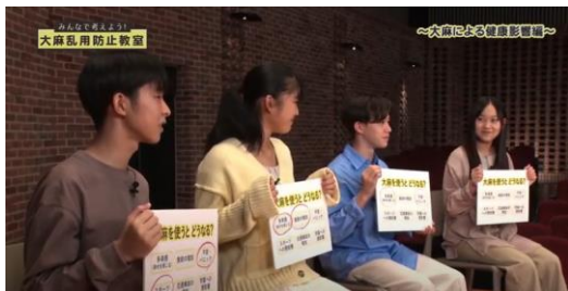
【大麻による健康影響編】(約14分)