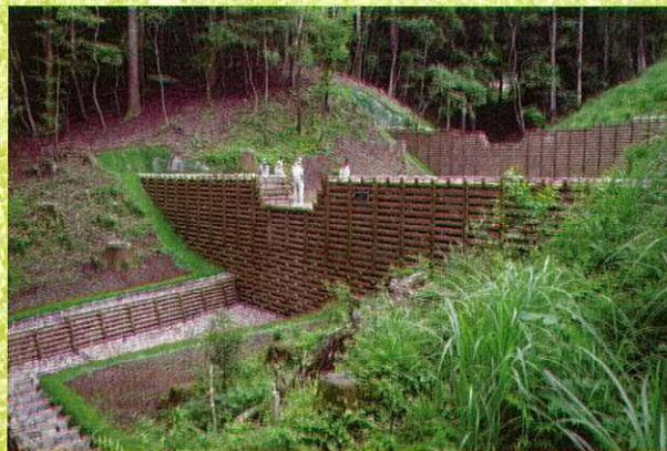
【令和2年度写真コンクール最優秀賞】 「平成31年度林地荒廃防止事業大鹿倉」 向井伸生 (宮崎県宮崎市)