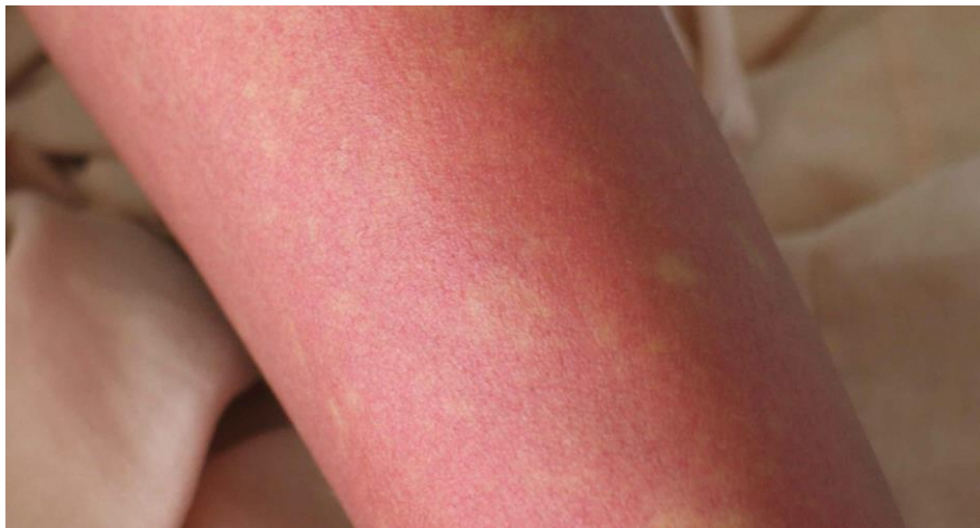
図 2. デング熱患者の発疹：解熱時期にみられた島状に白く抜ける紅斑