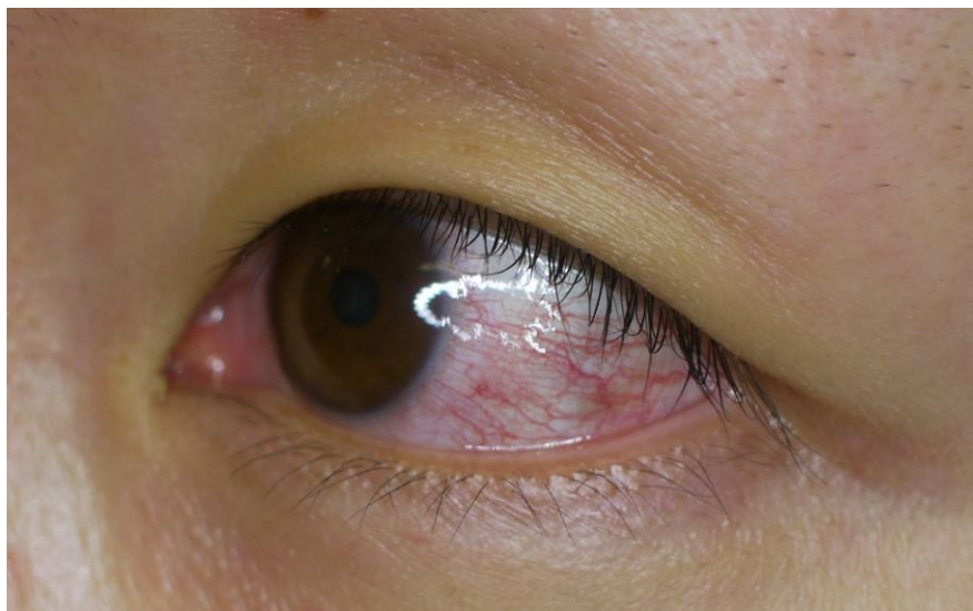
図4. ジカウイルス病の充血性結膜炎