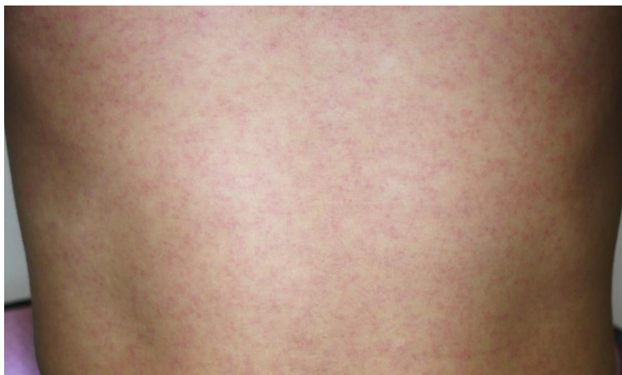
図3. ジカウイルス病の斑状丘疹様の発疹

潜伏期間は、2～12日（多くは2～7日）である。ジカウイルス病の臨床症状は多彩であるが、斑状丘疹様の発疹（ 図3 ）は90～100%に認められるのに対して、発熱の頻度は35～65%とされている 29,47 。また発疹は掻痒感を伴うことが多いとされている。また、大半の症例は入院を必要としなかった。 表7 に2015年のブラジル・リオデジャネイロにおけるジカウイルス病患者が発症後4日以内に認めた臨床症状を示す 47 。