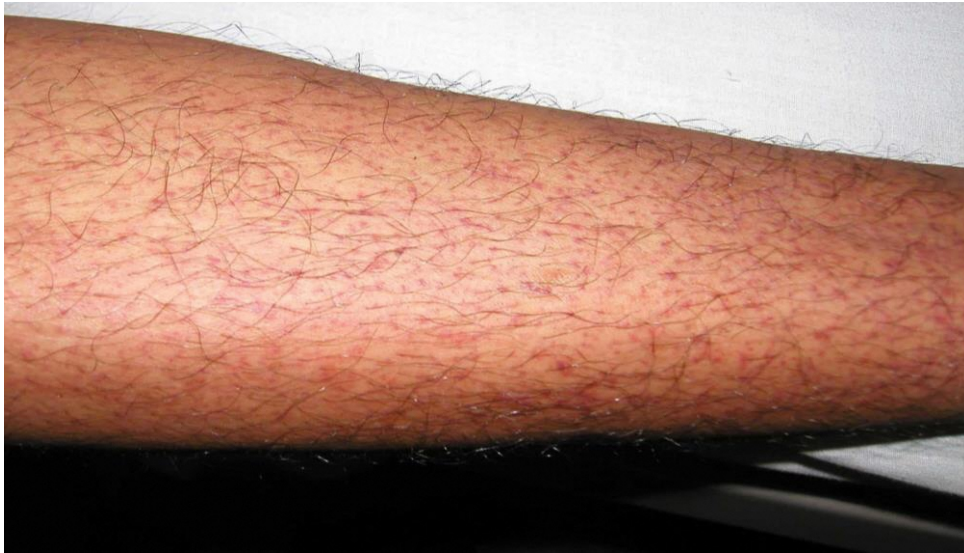
図 1. デング熱患者の発疹：解熱時期にみられた点状出血