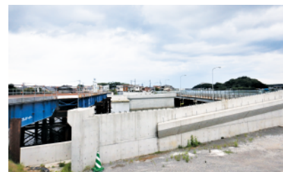
主要地方道 直方芦屋線 西祇園橋 (芦屋町)

損傷事例の多い構造を有している橋梁や河川の基準を満足していない橋梁などについては、判定区分にかかわらず計画的に架換えを実施し、予算の平準化を図ります。