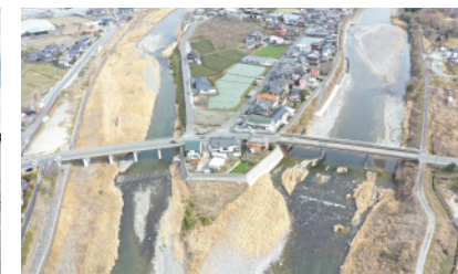
主要地方道 久留米立花線 星野川橋、上矢部川橋 (八女市)