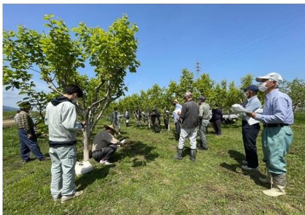
晴天の下で熱心に説明を聞いている参加者

今後も収穫期前の優良園地巡回や冬期管理勉強会を計画し、収量と品質の向上を目指していきます。普及指導センターでは、課題解決に向けた調査研究などを行いながら、生産者の技術力向上による経営安定を支援していきます。