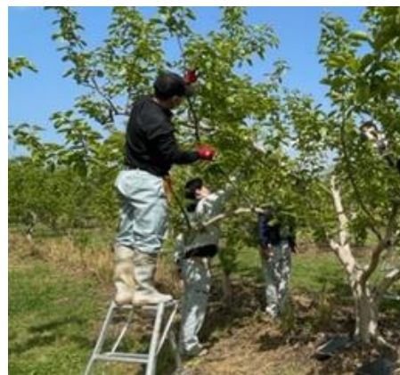
新梢管理を実演している様子