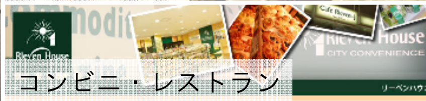
コンビニ・レストラン