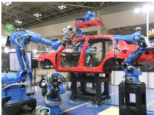
レアメタルリサイクルに取り組む 企業を特区事業者指定