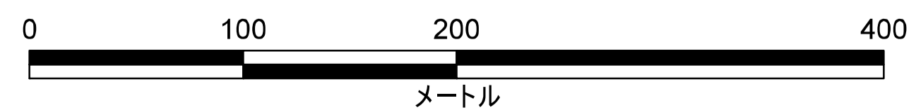
津波災害警戒区域 区域図

この地図は、北九州市長の承認を得て、同市都市計画課所管の測量成果を複製して作成したものである。(承認番号 平成29年北九建都計都第219号)