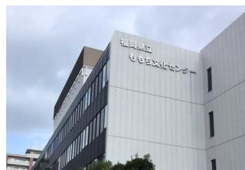
(写真:ももち文化センター全景)