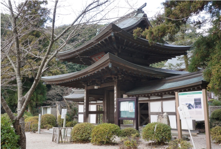
写真5 興国寺山門及び袖塀 外観南東から