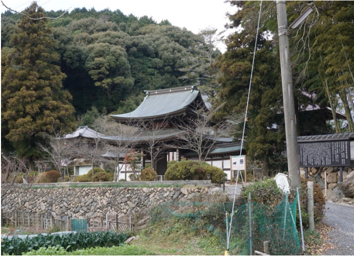
写真4 興国寺山門及び袖塀 全景南東から