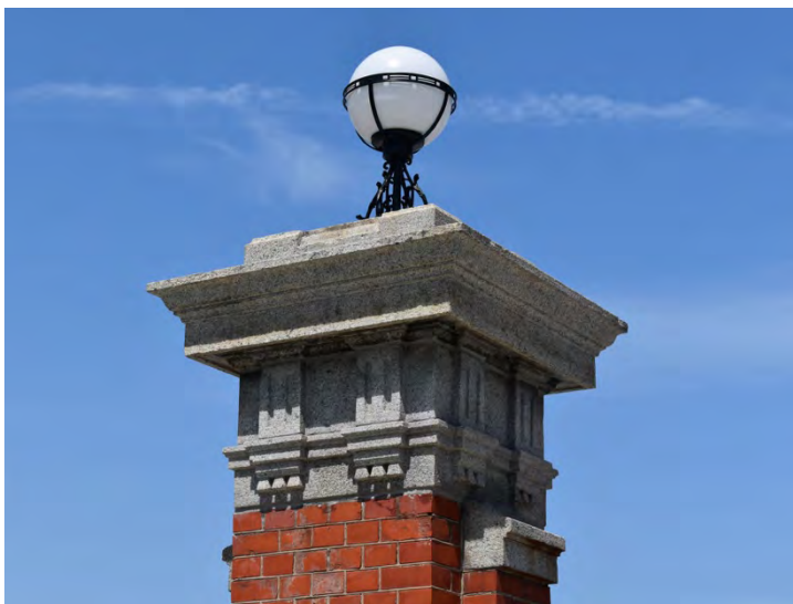
写真3 旧九州帝国大学正門及び塀 門柱柱頭