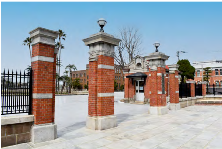
写真2 旧九州帝国大学正門及び塀 正面南から