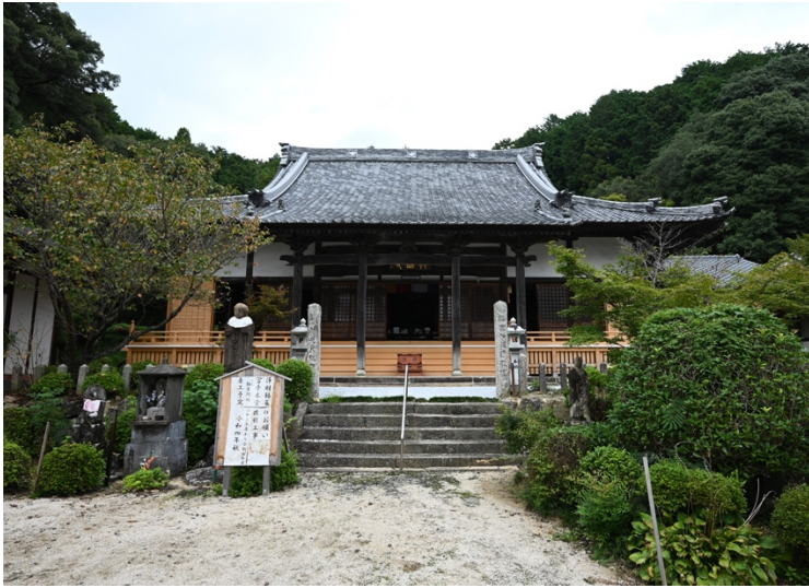
写真1 興国寺本堂 正面外観南から