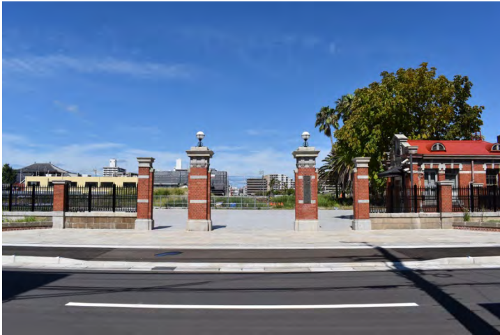
写真1 旧九州帝国大学正門及び塀 正面東から