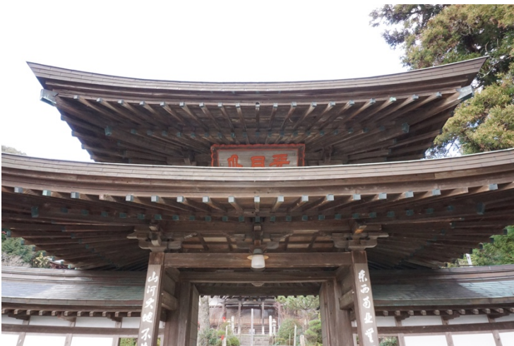
写真6 興国寺山門及び袖塀 正面外観南から