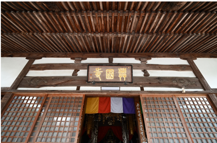
写真2 興国寺本堂 正面中央力士彫刻