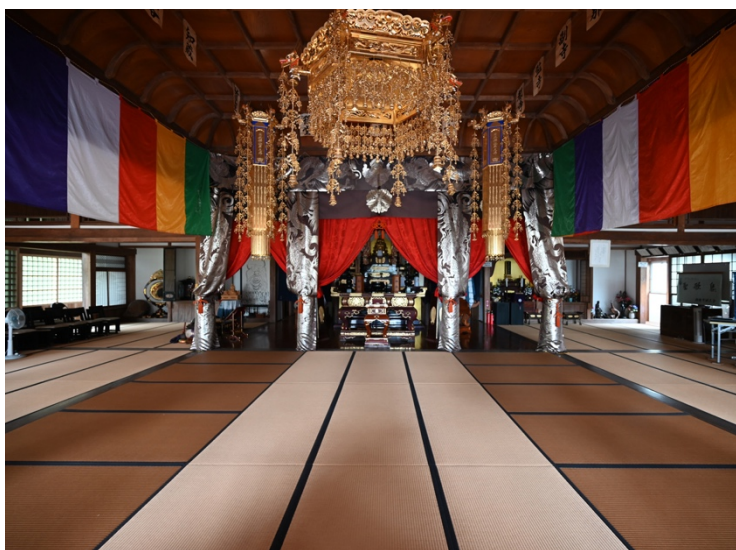
写真3 興国寺本堂 内部南から