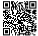
熱中症 しょう 予防情報サイト *

熱中症 しょう 予防のため、環境省 かんきょうしょう では「熱中症 しょう 予防情報サイト * 」で、全国各地の暑さ指数（WBGT）の提供を行っています。