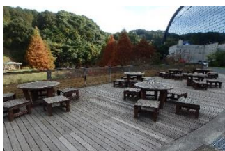
九州国立博物館 だざいふ (太宰府市)