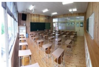
ささぐり ささぐり 篠栗町立篠栗北中学校 ささぐり (篠栗町)