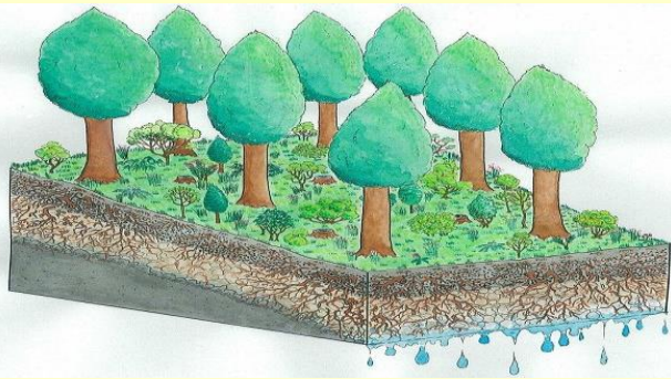
かんばつ 間伐などの手入れが行き届いた健全な森林