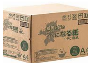
かんばつ 福岡県で間伐した木を 利用したコピー用紙