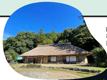
内部には当時の農機具 なども展示されている 「旧数山家住宅」