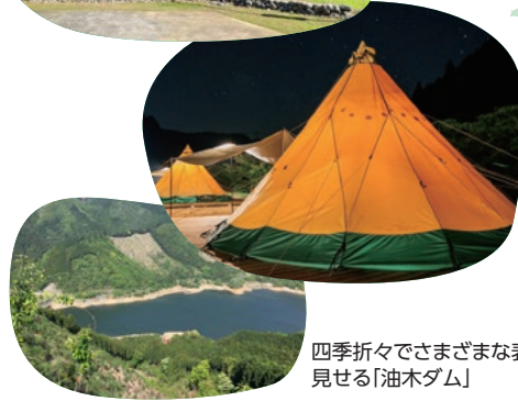
四季折々でさまざまな表情を 見せる「油木ダム」

紅葉、冬の雪景色と一年を通して四季折々の風景が映える 隠れたフォトスポットです。