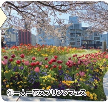
②一人一花スプリングフェス