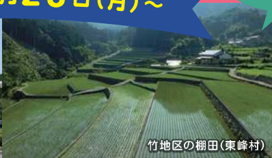
竹地区の棚田(東峰村)