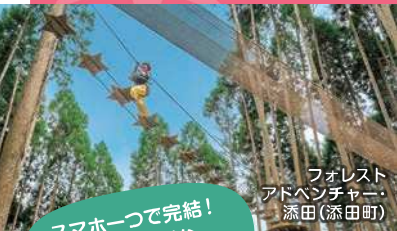
フォレスト アドベンチャー 添田(添田町)