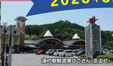
道の駅遊舎ひこさん(添田町)