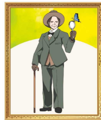
[1823年-1915年] ジャン・アンリ・ファーブル

イギリスを代表する作家の一人。最初の小説を発表したのは、37歳のとき。「なりたかった自分になるのに、遅すぎると言うことはない」という言葉を残した。