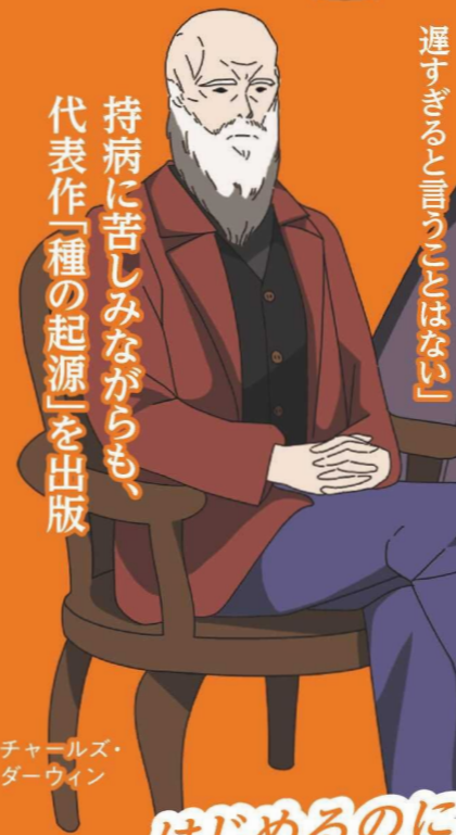
チャールズ・ダーウィン