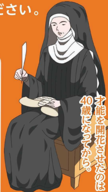
ヒルデガルト・フォン・ビンゲン