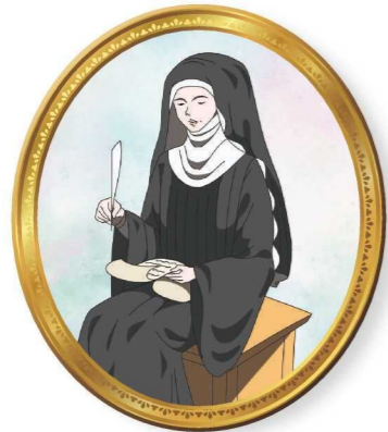
[1098年-1179年] ヒルデガルト・フォン・ビンゲン

古代から現代まで、世の中には「偉人」と呼ばれる人がいます。 人生の歩みは人それぞれで、悩んだり落ち込んだり、さまざまな紆余曲折があったりします。 偉人と言われる人たちもまた、世の中に認められるまでには人知れず苦労を重ねていました。 偉人たちの生き方に触れることで、ヒントが見つかるかもしれません。