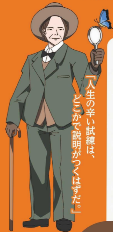
ジャン・アンリ・ファールブル