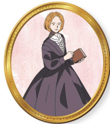
[1819年-1880年] ジョージ・エリオット

イギリスの自然科学者。40歳以降、慢性的な病気に苦しみ、多くの時間を家で過ごす中で、代表作である「種の起源」を出版した。