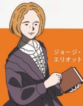
ジョージ・エリオット