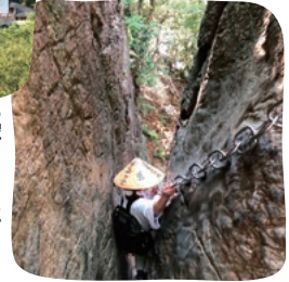
善人しか通れないと伝わる「はさみ岩」

も う一つのおすすめは「森林セラピー※」。町の約70%を森林が占める篠栗町には、6つのセラピーコースがあります。「森はいつでも素のままの自分を受け入れてくれます。目を閉じ、耳を澄まして、大地に寝転び、最高の癒やしを体感してくださいね！」