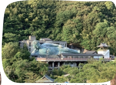
第1番札所 南蔵院の釈迦涅槃像

お 遍路さんが泊まる旅館や宿坊は、100年を超える老舗をはじめ、手打ちそばや懐石料理、精進料理などおもてなしに趣向を凝らした宿など、バリエーションも豊富。