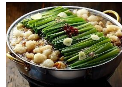
<もつ鍋游来・もつ鍋>