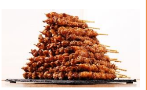
<博多華善・とり皮巻き巻き>