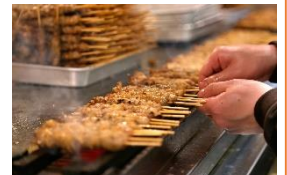
<かわ屋・かわ焼き>