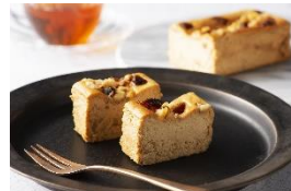
<デーツオアシス・チーズケーキ>