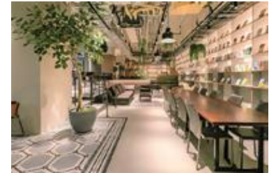
コワーキングスペースQ