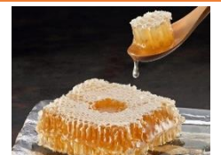
<馬渡はちみつ・巢入完熟蜜>