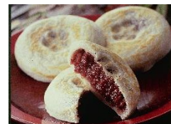
<かさの家・梅ヶ枝餅>