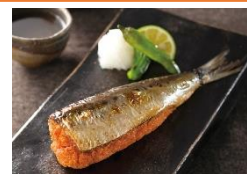
<中島商店・いわし明太子>