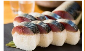
<吉祥庵・さば寿司>