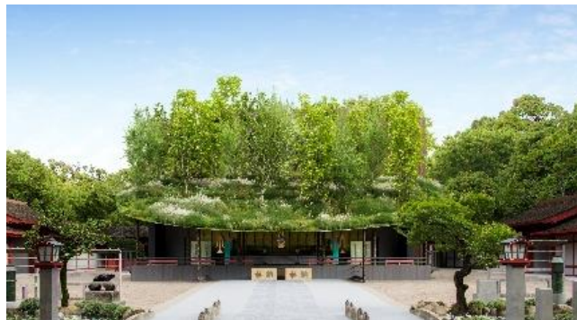
5月に完成予定の仮殿（想定）©藤本壮介建築設計事務所