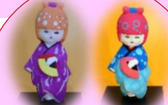
HAKATA DOLLS 各展先着10名

「第66回新作博多織展」または「第73回新作博多人形展」にご来場、プレゼント引換用はがきを受け取る