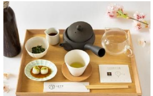
八女伝統本玉露(温)