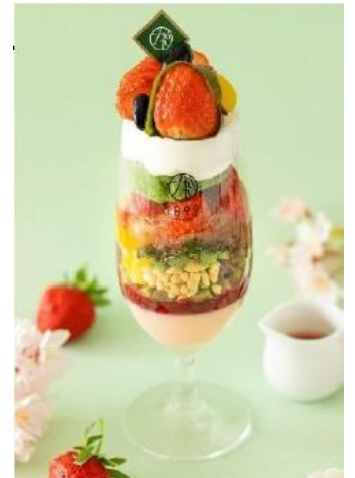
あまおう苺と桜の春色パフェ