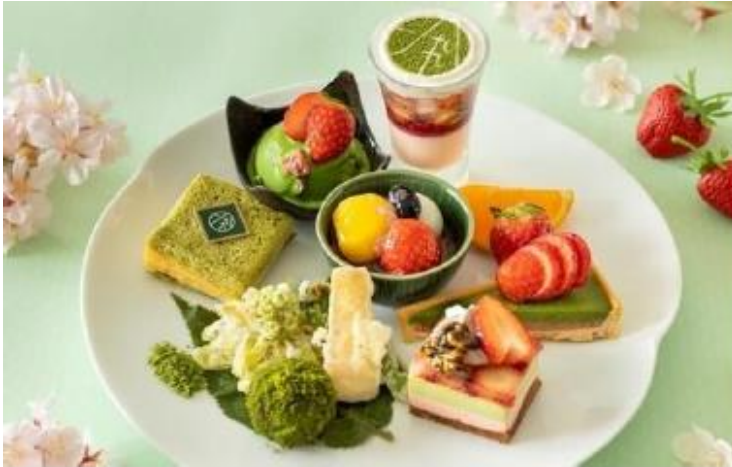
1899アフタヌーンティープレート

※ RESTAURANT 1899 OCHANOMIZU のみでの提供となります。