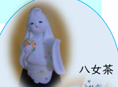
八女茶 花つつみ 先着20名