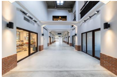
1階イベントスペース