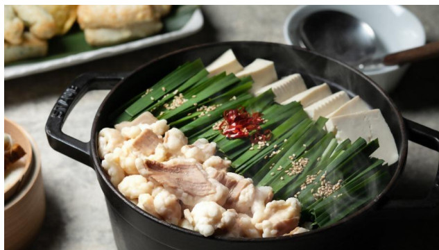
もつ鍋（buffetダイニング ケッヘル）