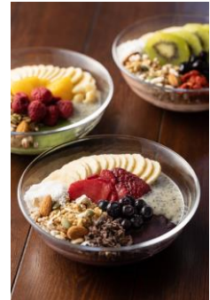
カフェで提供される フルーツボウル