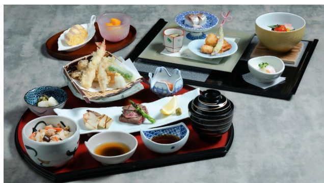
ミニ会席（日本料理 羽衣）