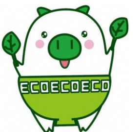
福岡県マスコットキャラクター 「エコトン」

福岡銀行、西日本シティ銀行、筑邦銀行、福岡中央銀行、佐賀銀行、北九州銀行、十八親和銀行、熊本銀行、佐賀共栄銀行、西京銀行、豊和銀行、三菱UFJ銀行、三井住友銀行、福岡信用金庫、福岡ひびき信用金庫、大牟田柳川信用金庫、筑後信用金庫、飯塚信用金庫、田川信用金庫、大川信用金庫、遠賀信用金庫、福岡県信用組合、横浜幸銀信用組合、商工組合中央金庫（以上24金融機関）