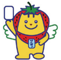
明るい選挙キャラクター あまおうめいすいくん