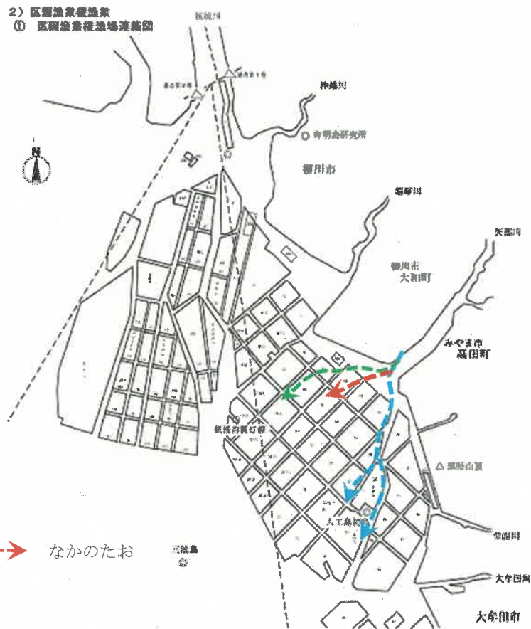
上段：過去の地形図、下段：現在の地形図