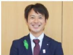
菅野大志 西川町長