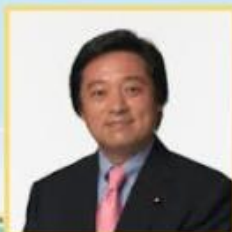
若宮 健嗣 デジタル田園都市国家構想担当大臣