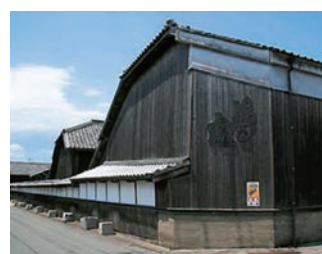
酒どころ城島の町並み