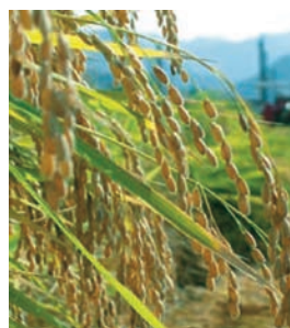
県内で多く栽培される「山田錦」

県内に67ある酒蔵では、これらの県産酒米を使用した日本酒に加え、麦焼酎を中心とした多種多様な焼酎が醸されています。