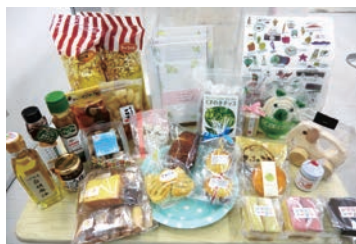
まごころ製品の一例

1年間に10万円以上の「まごころ製品」を購入した企業等を「障がい者応援まごころ企業」として認定