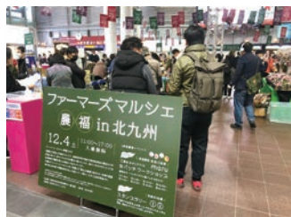
「農業」と「福祉」の連携で生まれた農産物等を販売する「農福連携マルシェ」