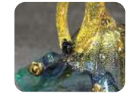
福岡積層工芸ガラス