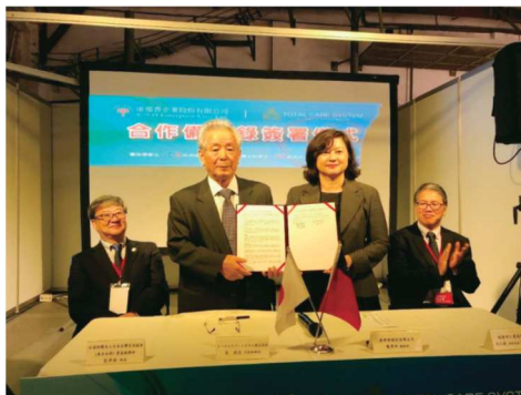
（写真1）トータルケア・システム（株）と KNH 社による MOU 締結

指している。使用済み紙おむつの水溶化処理・再資源化の技術を有するトータルケア・システム株式会社（福岡市）と台湾大手の紙おむつメーカーである康那香企業股份有限公司（KNH 社）が台湾における使用済み紙おむつリサイクルの事業化に向けて全面的に協力していくことに合意する MOU を締結する等、着実に成果を上げている。日本と同様に台湾においても高齢化が進む中で、良質なパルプを含む紙おむつのリサイクルの重要性は高まっており、今後の両社の連携による事業の推進が望まれる。