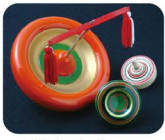
7 はか た こま 博多独楽