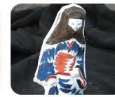
26 あか ぎ か ん びん 赤坂人形