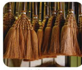
14 し ょ う らん 棕欄蓆