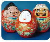
8 はか た ばり こ 博多張り子