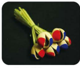
12 ひ こ さん 英彦山がらがら