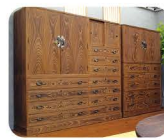
32 おお かわ そう せ り た ん す 大川総桐筆筒