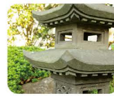
23 や め し と う 八女石灯ろう