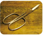
6 はか た ばさみ 博多鋏