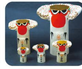
11 き 木うそ