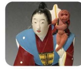
10 いまじろ にんぎょう 今宿人形