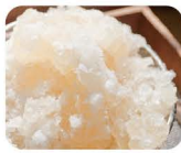
28 てん ねん し ょ う の う 天然樟脳