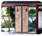
20 や め 八女すだれ