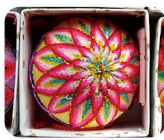
34 や な が わ 柳川まり