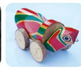
27 き ぐ ま きじ車