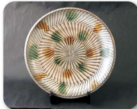
こ い し わら やき 小石原焼