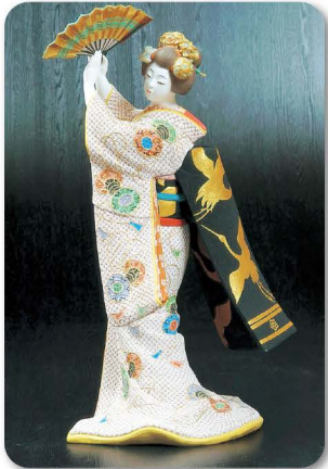
はか た にんぎょう 博多人形