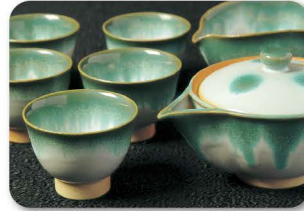
あ が の やき 上野焼