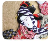
15 く る め 久留米おきあげ