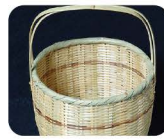
22 や め た げ ざ い く 八女竹細工