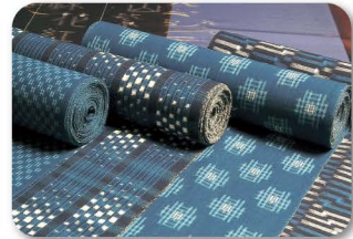
く る め か ず 久留米紬