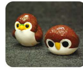
3 つ や ざき にんぎょう 津屋崎人形