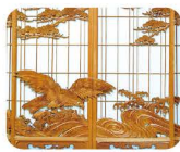
30 おお かわ せう こく 大川彫刻