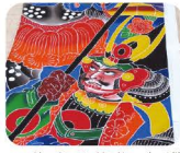
13 は き こ がつせつ くの り 杷木五月節句織