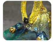
4 みく おか せき こう げい ひん 福岡積層工芸ガラス