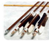
24 や め や 八女矢