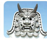
18 し ょ う じ ま ね に が り 城島鬼瓦