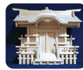
33 や な が わ か み だ な 柳川神棚