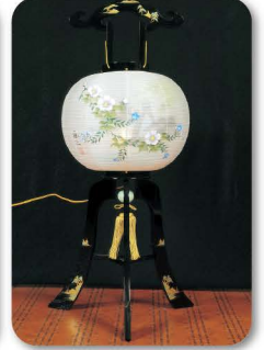
や め ちょうちん 八女提灯