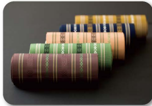
はか た おり 博多織