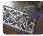
16 なべしま たんづつ 鍋島綴通