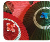
19 ちく わ が 傘 筑後和傘