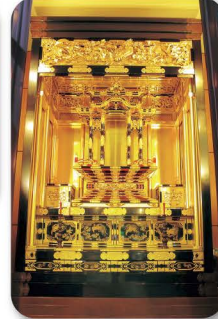
や め ふくしま ぶつ だん 八女福島仏壇