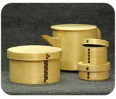
5 はか た まげもの 博多曲物