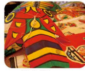
1 まこ じ だ こ 孫次風