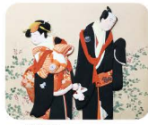
9 はか た 博多おきあげ