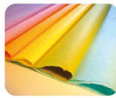
21 や め て す き わ し 八女手漉和紙