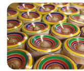
25 や め わ 八女和ごま