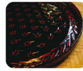
17 らん たい し ょ ぎ 藍胎漆器