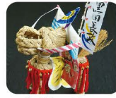
2 はつさく うま 八朔の馬