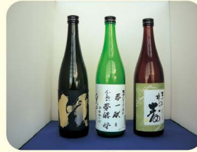
福岡オリジナル吟醸酒

福岡県では、生物の持つ能力や性質をいかす「バイオ技術」を活用して、産業を振興しています。 久留米市など筑後地域は、昔から醤油や味噌など発酵食品の製造が盛んであり、また日本酒を造る酒蔵もたくさんあります。この地域を中心に新しい薬や健康食品、福岡県独自のお酒などの製品ができたり、バイオに関係する企業が新しく設立されたりするよう、研究開発の支援などを行っています。