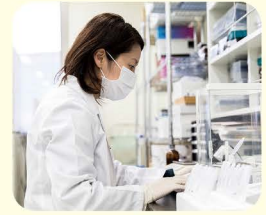
新型コロナウイルス治療薬開発に 取り組む久留米市の㈱ボナック の研究の様子