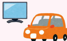
電器屋、自動車販売店など