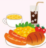
喫茶店、レストランなど