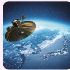
福岡県の宇宙ベンチャー ㈱QPS研究所が開発した 超小型レーダー衛星

福岡県には、宇宙開発に挑戦する企業や、宇宙に関する研究を行っている九州大学、九州工業大学などがあります。 このような企業、大学といっしょに、人工衛星やロケット、人工衛星からのデータを活用した新しいサービスの開発に取り組んでおり、宇宙ビジネス振興の取り組みに熱心な県として、国から「宇宙ビジネス創出推進自治体」に選ばれています。