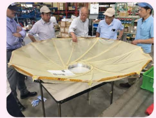
衛星の開発には県内のたくさんの ものづくり企業が関わっています