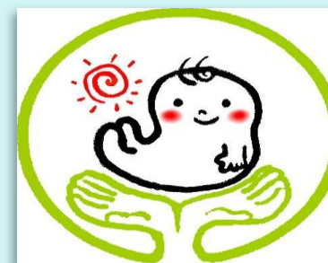
「子育て応援の店」の登録推進