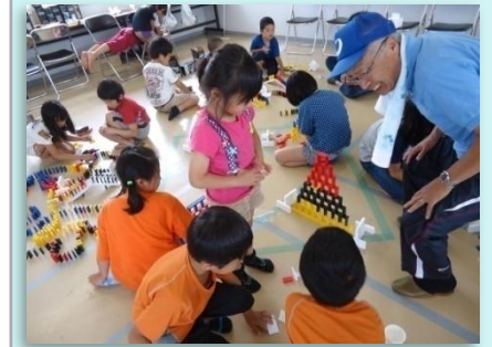
アンビシャス広場

・「青少年アンビシャスの翼」 平成26年7～8月の19日間、大自然の中で外国青少年と寝食を共にし、互いに切磋琢磨するサマーキャンプ（米国）に、県内の中学・高校生を20人派遣しました。