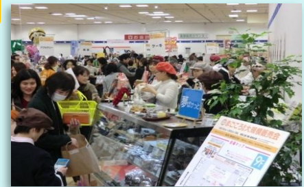
「まごころ製品」大規模販売会

また、平成26年10月からは、1年間に10万円以上のまごころ製品を購入した企業を認定する「障害者応援まごころ企業認定制度」を全国で初めて開始しました。今後も、まごころ製品の積極的な活用やPRを行っていきます。