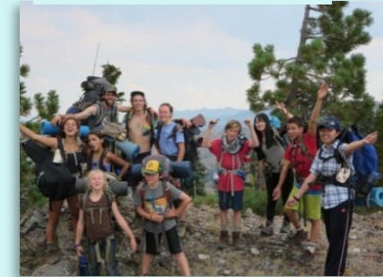
青少年アンビシャスの翼