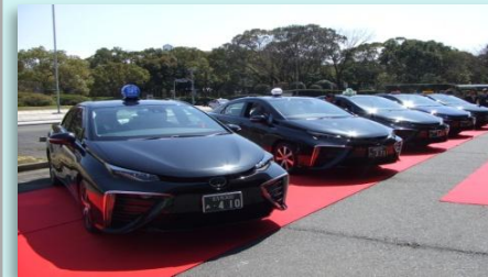
全国初！FCVタクシー導入