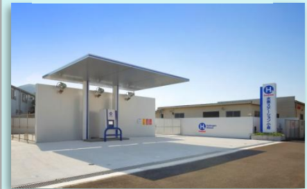
九州発にオープンした「イワタニ水素ステーション小倉」