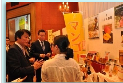
農と商工の自慢の逸品展示商談会