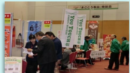
「まごころ製品」商談会