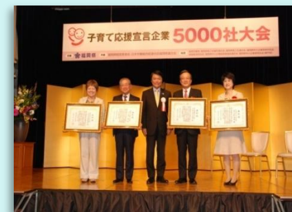
子育て応援宣言企業5000社大会