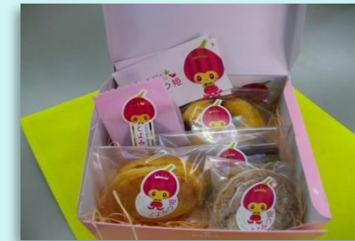
とよみつひめ（いちじく）のお菓子の詰め合わせ