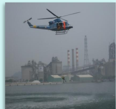
津波転落者救出訓練

今後も防災関係機関との連携、地域防災力の強化を図り、安全・安心で災害に強い福岡県づくりに取り組んでいきます。