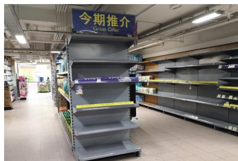
(写真1) ティッシュペーパーの在庫がなくなったスーパーの棚 (2月13日筆者撮影)

香港での感染者が確認されて以降、春節明けの2月初旬までは、ドラッグストアにマスクを買い求める市民の行列が起きたり、スーパーでトイレットペーパーやティッシュペーパーの在庫が無くなったりするなど(写真1)、日常生活に一時的な混乱が見られた。また、香港マラソンはじめ大型イベントの開催中止、香港ディズニーランドなどの遊戯施設の臨時休園、そして感染予防として外出を控える香港市民が増えたため、飲食店や小売業界などは非常に厳しい経営環境に直面している。