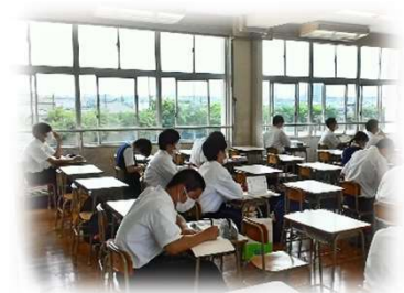
<学校再開後の授業風景>