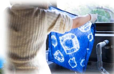
<久留米絣工房(筑後市)>