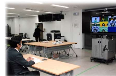
<ウェブ会議システム>