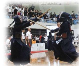
<全国高校総体(インターハイ)>