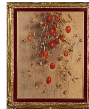
<高島野十郎「からすうり」 (福岡県立美術館蔵)>