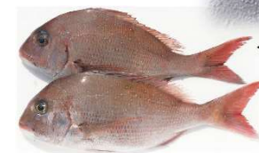
<県産水産物(マダイ)>