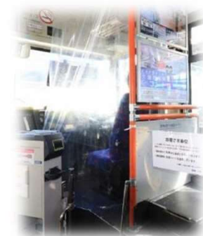
<バスの仕切りカーテン>