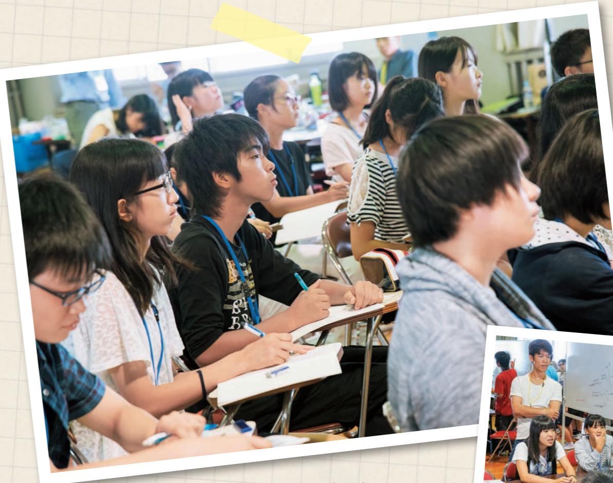
講師の話聞き逃さない、講義を真剣に聞く塾生たち

福岡県が策定したこのビジョンは、「学力、体力、豊かな心」、「社会にはばたく力」、「郷土と日本、そして世界を知る力」を育むための青少年育成策の方向を示しています。「郷土と日本、そして世界を知る力」を身に付けるためには、郷土と日本の歴史、文化、伝統などに対する理解を深めるとともに、広い視野を持って異文化を理解し、異なる習慣や文化の人々と共に生きていくための資質や能力を身に付けることが必要になります。