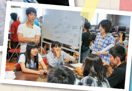
グループワークでは、リーダーとともに問題の解決策について話し合う